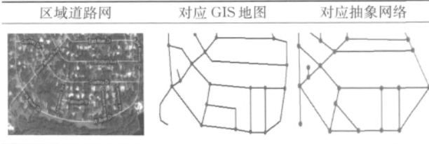
Tab.1 Conventional method analysis of road network

型路网是指 TAZ 道路网形态含有方格路网、平行曲线路网、尽端路+环形路中两种及以上路网形态的。分析结果表明 Meshedness 值对四类路网具有很好的区分度,不同道路类型对应的 Meshedness 取值区间见表 2。